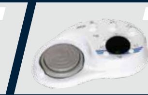
Pedal de comando móvel independente multifuncional