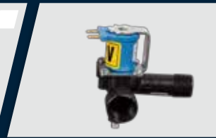
Acionador sensorizado para água da unidade auxiliar com regulador de vazão