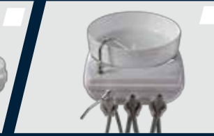
Seringa tríplice incorporada à unidade auxiliar