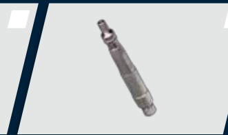
Terminal de baixa rotação com sistema de refrigeração