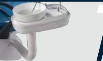
Tubulação totalmente embutida