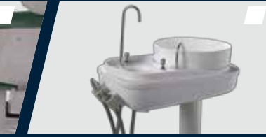
Rebatimento da unidade auxiliar com movimento de 90° a 180°