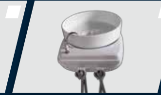
Segundo sugador incorporado à unidade auxiliar