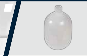
Reservatório de água com capacidade de 1.000 ml (1L)