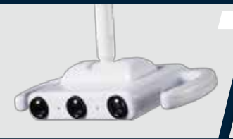
Cabeçote do refletor com iluminação por LED