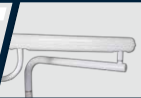
Braço flex com travamento pneumático