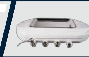
Terminal extra para alta rotação