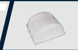
Caixa de comando independente