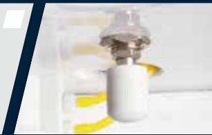
Regulagem externa de água e ar do equipo