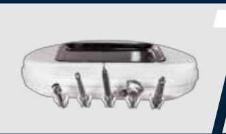
Jato de bicarbonato e ultrassom acoplado