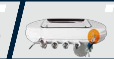
Fotopolimerizador de LED acoplado