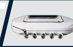
Equipo com 5 pontas