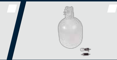
Sistema de assepsia e desinfecção do equipo com válvula antirretração