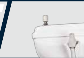
Kit suctor para bomba de vácuo