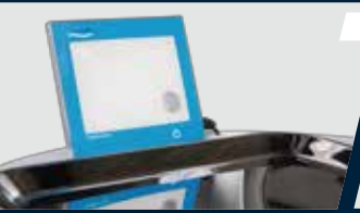
Negatoscópio de LED acoplado