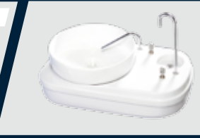
Porta-copo incorporado à unidade auxiliar